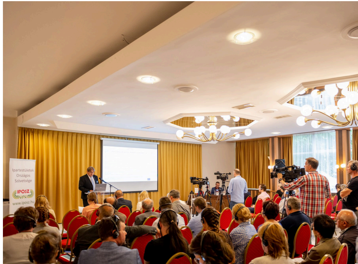
Németh László megnyitó beszéde az Ipartestületek Országos Szövetségének (IPOSZ) nemzetközi szakmai konferenciáján.